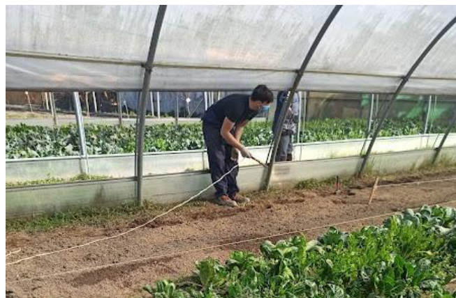
I Giardini di SCF

Per quanto riguarda i questionari di valutazione, è emerso in particolare che quasi tutti i partecipanti (6 su 7) hanno trovato utile l'Open Badge e vorrebbero che fosse rilasciato. Inoltre, molti hanno dichiarato di essersi sentiti bene quando sono state poste le domande, perché è stata chiesta la loro opinione e quindi si sono sentiti coinvolti nell'attività.