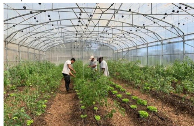
Partecipanti al giardino di Equalis' in Francia