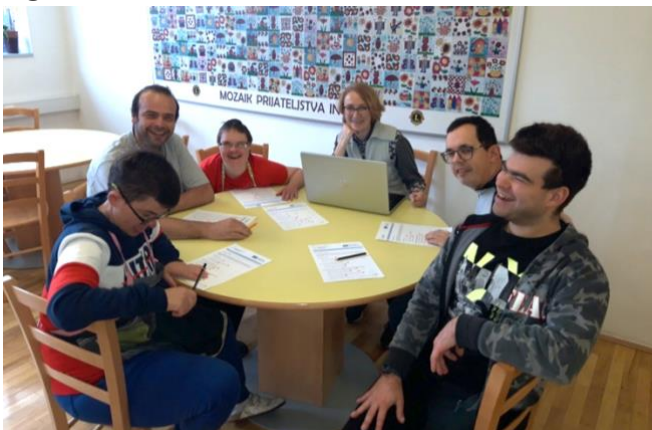
Partecipanti alla sperimentazione in Slovenia

La prima parte della seconda sperimentazione è stata condotta il 19 luglio e la seconda parte è seguita il 3 agosto. I due valutatori erano un lavoratore a progetto e un supervisore. Nella seconda sperimentazione sono stati coinvolti 7 partecipanti. Nel complesso, la seconda sperimentazione ha funzionato bene e i partecipanti sono stati felici di partecipare. Durante l'autovalutazione, i partecipanti avevano bisogno di un supporto verbale e di spiegazioni per comprendere le affermazioni ed essere in grado di autovalutarsi. La soluzione è stata quella di effettuare la valutazione in gruppo, perché era la più semplice per tutti.