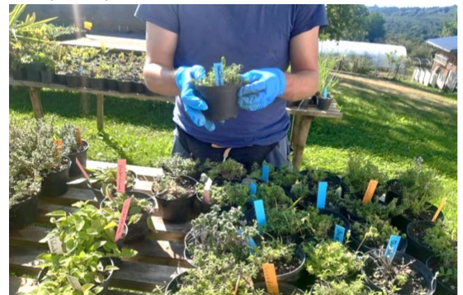
La fattoria biologica di Chance B