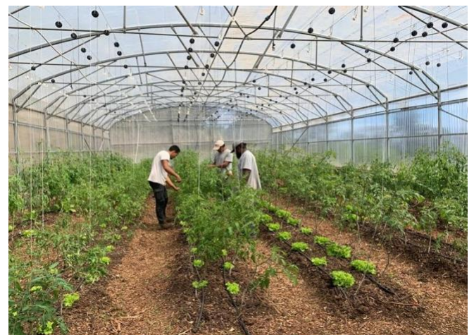
Vrtovi organizacije ALIE in njihovi udeleženci testiranja

pomočnika parkovnega vrtnarja. Pri testiranju sta sodelovala 2 trenerja in 14 udeležencev. Za udeležence je bilo samoocenjevanje zanimivo, čeprav včasih zahtevno. Trenerji menijo, da ima ta način ocenjevanja potencial, vendar je na tej točki preveč zamuden.