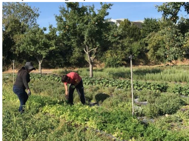
Udeleženci na vrtovih organizacije Equalis v Franciji

potekalo od julija do septembra na njihovih vrtovih v pariških regijah. V njem sta sodelovala dva trenerja in šest udeležencev usposabljanja. Udeleženci so z velikim veseljem ocenjevali sami sebe in pri ocenjevanju pomagali drug drugemu, saj je le-to potekalo v parihi. Izvajalca usposabljanja sta povedala, da je bilo lažje ocenjevati udeležence v parihi, saj je bila izmenjava znanja tako bogatejša.