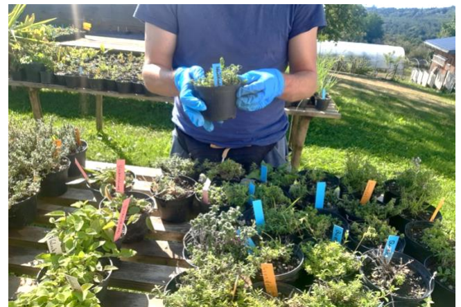
Ekološka kmetija organizacije Chance B