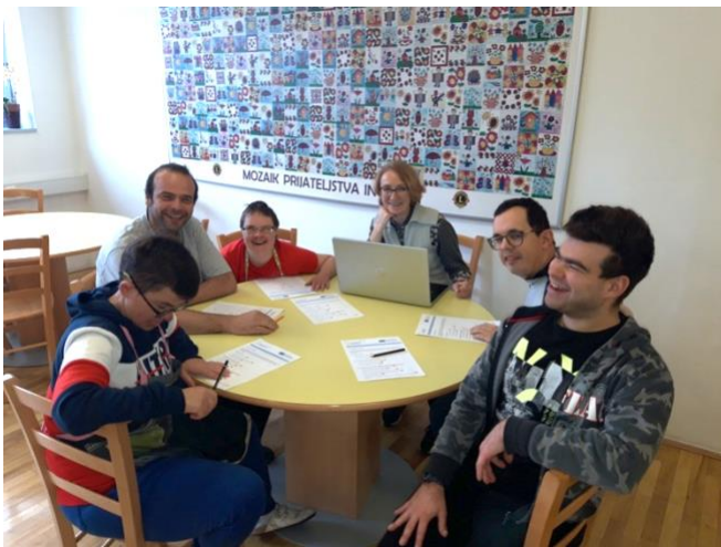
Udeleženci testiranja v Sloveniji

sedem udeležencev. Mehke veščine kot so komunikativnost, organiziranost in zavzetost so trenerji ocenjevali na delovnem mestu in s pomočjo dodatnih razgovorov. Na splošno je drugo poskusno ocenjevanje potekalo dobro, udeleženci pa so z veseljem sodelovali. Med samoocenjevanjem so potrebovali dodatno razlago, da so razumeli trditve in so se lahko ocenili. Zato so se odločili za skupinsko ocenjevanje. Po eni strani je to omogočilo, da se trditve pojasnijo vsem hkrati, po drugi pa je skupinsko ocenjevanje pomenilo dodano vrednost za udeležence, ki so se lahko učili iz povratnih informacij in pogledov svojih vrstnikov.