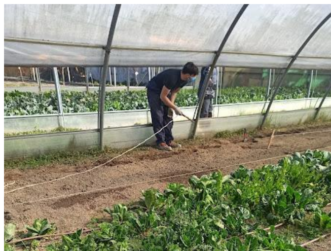
Vzdrževanje vrtov v Italiji

V zvezi z ocenjevalnimi vprašalniki se je izkazalo, da so skoraj vsi udeleženci (6 od 7) menili, da je odprta značka koristna, in bi jo radi prejeli. Poleg tega so mnogi dejali, da so se pri spraševanju dobro počutili, saj so jih spraševali po njihovem mnenju in so se zato počutili vključene.